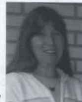
Das Gespräch führte Hella Hartel

Als ich wieder zu Hause war habe ich gedacht, so was machst du nie wieder. Aber im folgenden Jahr war ich wieder unterwegs. ...“